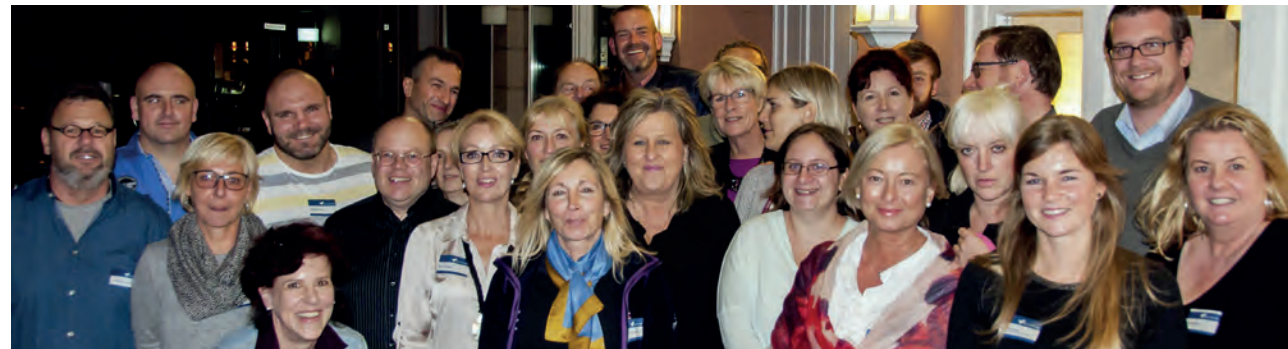
Studentinnen und Studenten des Fernstudiums Bachelor Berufsbetreuer, Wintersemester 2017/18