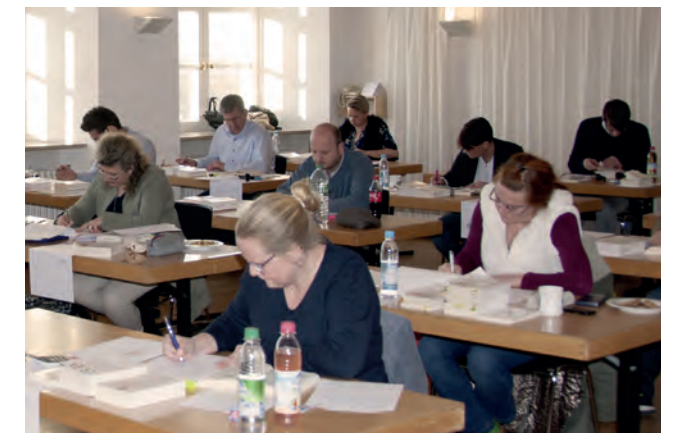
Fotos von Repetitorium, Get2Gether und Abschlussprüfung der BeckAkademie Fernkurse (2013 bis 2019)